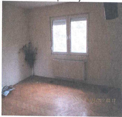
Соба на кат