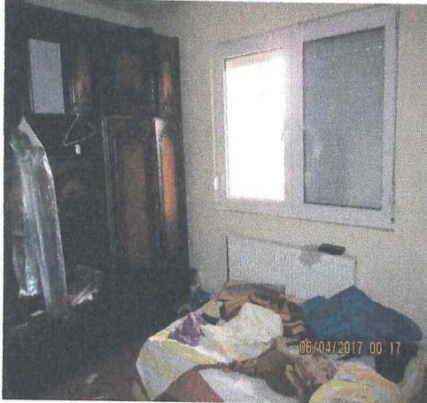
Соба на кат