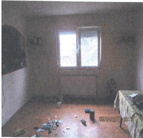
Трпезарија на кат