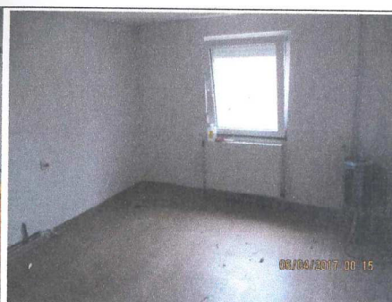
Соба на приземје