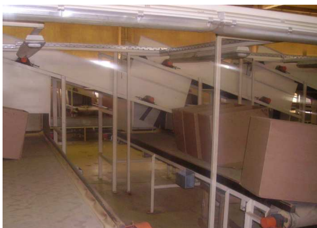
Местоположба Струмица Табак АД Струмица, Струмица